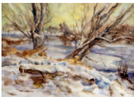
Winterliche Donaulandschaft bei Irlbach

Öffnungszeiten: Samstag und Sonntag jeweils 13.00–18.00 Uhr und Mo. 03.10.